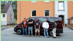
Betreutes Wohnen in 2 Wohneinheiten für je 2 Jugendliche auf dem Heimgelände