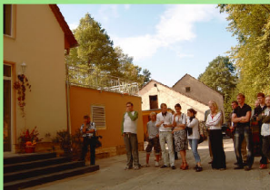
3 gemischte Wohngruppen mit jeweils 8 Plätzen