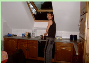
Intensive sozialpädagogische Einzelbetreuung ISPE